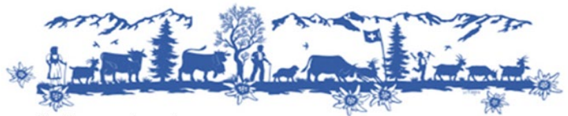
B. Schöpfer Baggerbetrieb